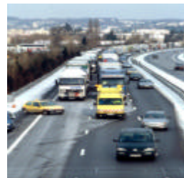
Stockage des PL sur A7