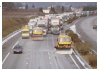
Remise en circulation des PL nécessitant des accompagnements en convoi y compris sur la voie rapide, Celle-ci étant vite occupée malgré l'interdiction

Déneigement voie lente et médiane : Les PL restent à droite derrière les convois de déneigement très peu doublés car la 3ème voie leur est interdite et n'est pas déneigée.