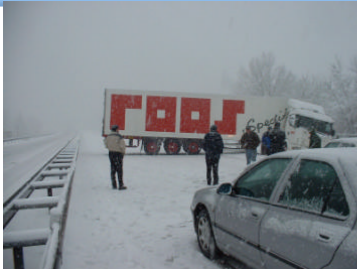
Congrès Interroute - Montpellier - 30 septembre 2004