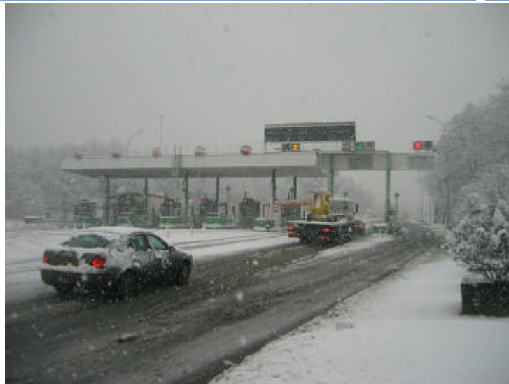
Congrès Interroute - Montpellier - 30 septembre 2004